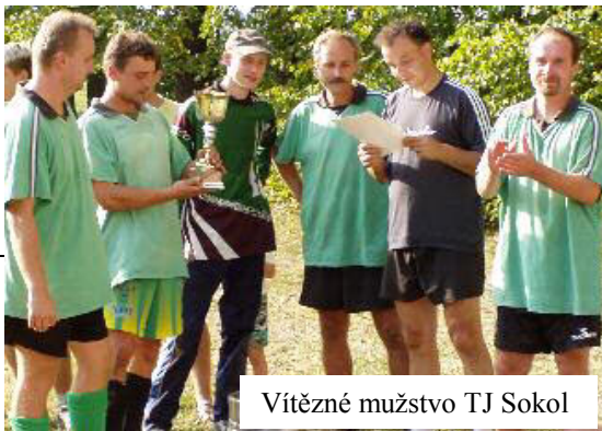
Vítězné mužstvo TJ Sokol

DDD Buzková – Kohutková OBKLADY, DLAŽBA GAJDOVÁ Obecní úřad Chotěbuz ATOMOVÉ OKURKY