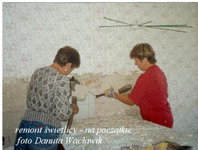
remont świetlicy - na początku

Młodzi sportowcy z obu kół PZKO wzięli udział w turnieju o Puchar Gminy. Z roku na rok ich umiejętności rosną. Cieszy nas jeden wygrany mecz, dziękujemy im za ich wysiłek.